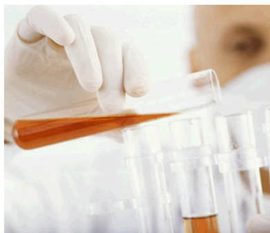
Proxeon – Forskning i proteiner