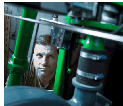
Stirling DK – CO 2 -neutral kraftvarme