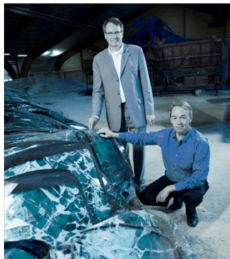
Shark Solutions – Genbrug af bilruder