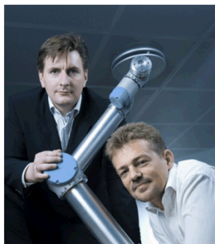
Universal Robots – Fleksibel robot-arm